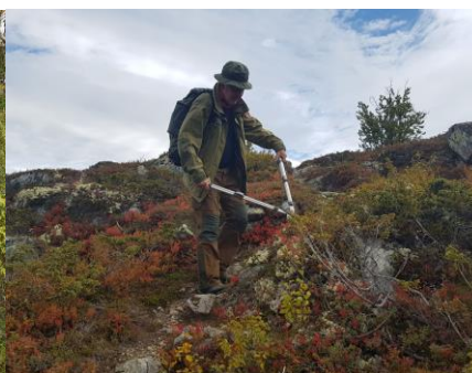
Borgegrammin høst 2020