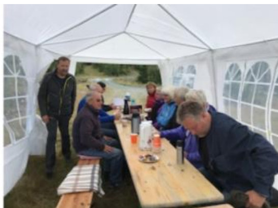
Fra generalforsamlingen 2019

Etter innspill vedr. bord ved badekulp, ble det besluttet å kjøpe ferdig bord med faste benker og integrert grill i bordplaten fra ASVO Kongsberg.