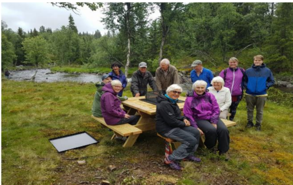
Grillbord på plass i badekulpen