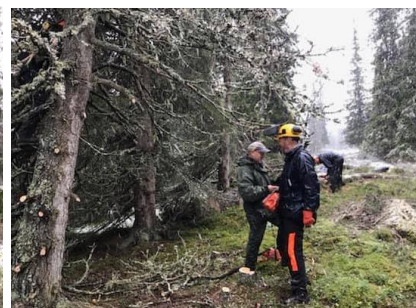
Skjønnegrammin høsten 2020