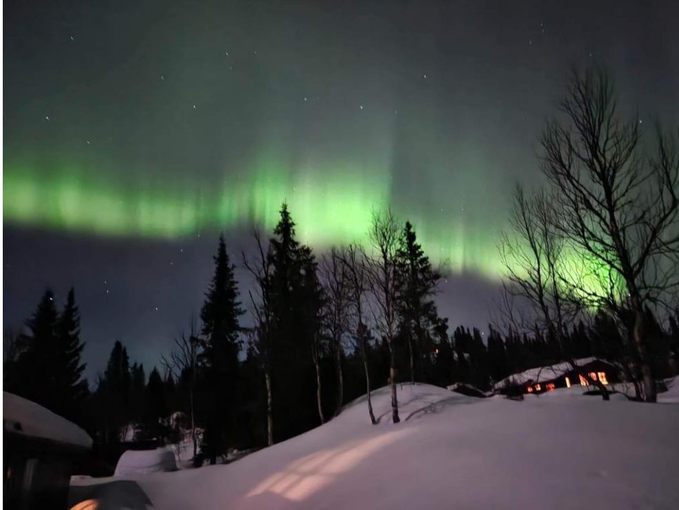
Årets bilde hos Facebook-gruppa til Borgemarka hytteforening

Styrets beretning til årsmøtet 2023, september 2022 - september 2023