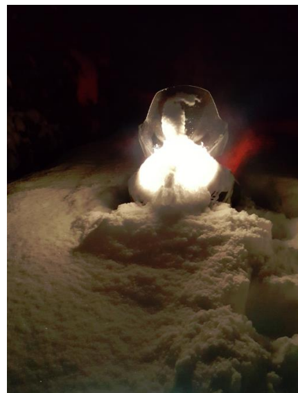
2. februar