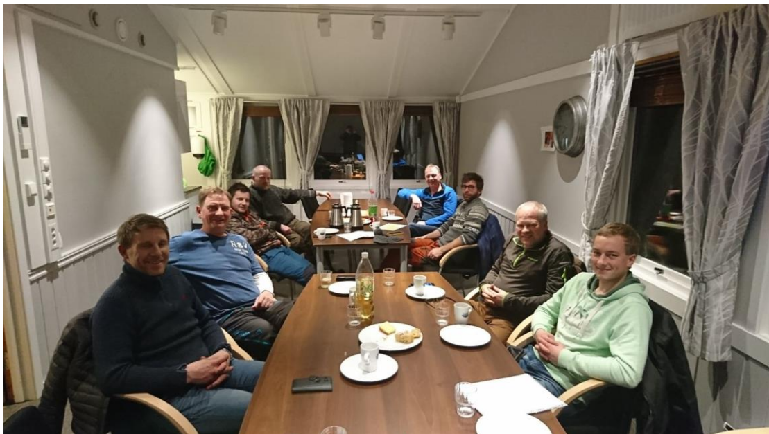
Bilde fra møte med løypekjører før sesongen startet.

Det var planlagt å avholde nytt styremøte og møte med løypekjørere etter vinterferien. Det ble ikke mulig på grunn av koronaepidemien. Det ble avholdt et styremøte 8. mai.