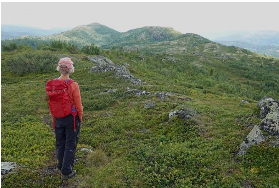
Fra stien over Ryggfjellet sett sørover mot Bjorstulfjellet (i bakgrunnen til venstre)