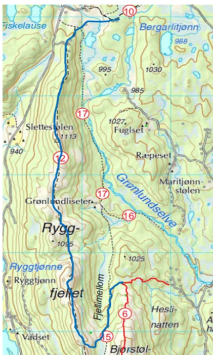
Sti nr. 12 over Ryggfjellet til Bjorstulfjell via Fjellimellom