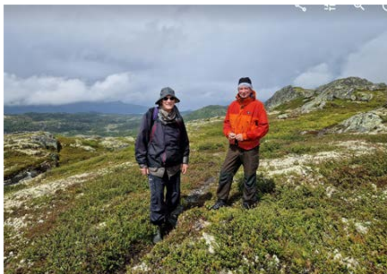
Fra befarings av planlagt sti over Ryggfjellet (i regnvær)